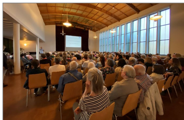
Foto: ausgebuchter Saal beim Vortrag im Frühling